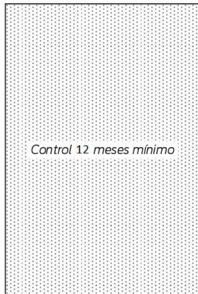
Control 12 meses mínimo

CADA CASO CLÍNICO debe incluir una hoja de historia, otra de tratamiento y otra de radiografías. La HOJA DE RADIOGRAFÍAS deberá ser de CALIDAD FOTOGRÁFICA. El tamaño de la imagen radiográfica impresa debe estar entre 4x7 cm y 6x9 cm y tener una resolución mínima de 300 ppp. En el CD que debe adjuntarse las imágenes pueden presentarse en formatos JPEG, TIFF o PPT (PowerPoint)